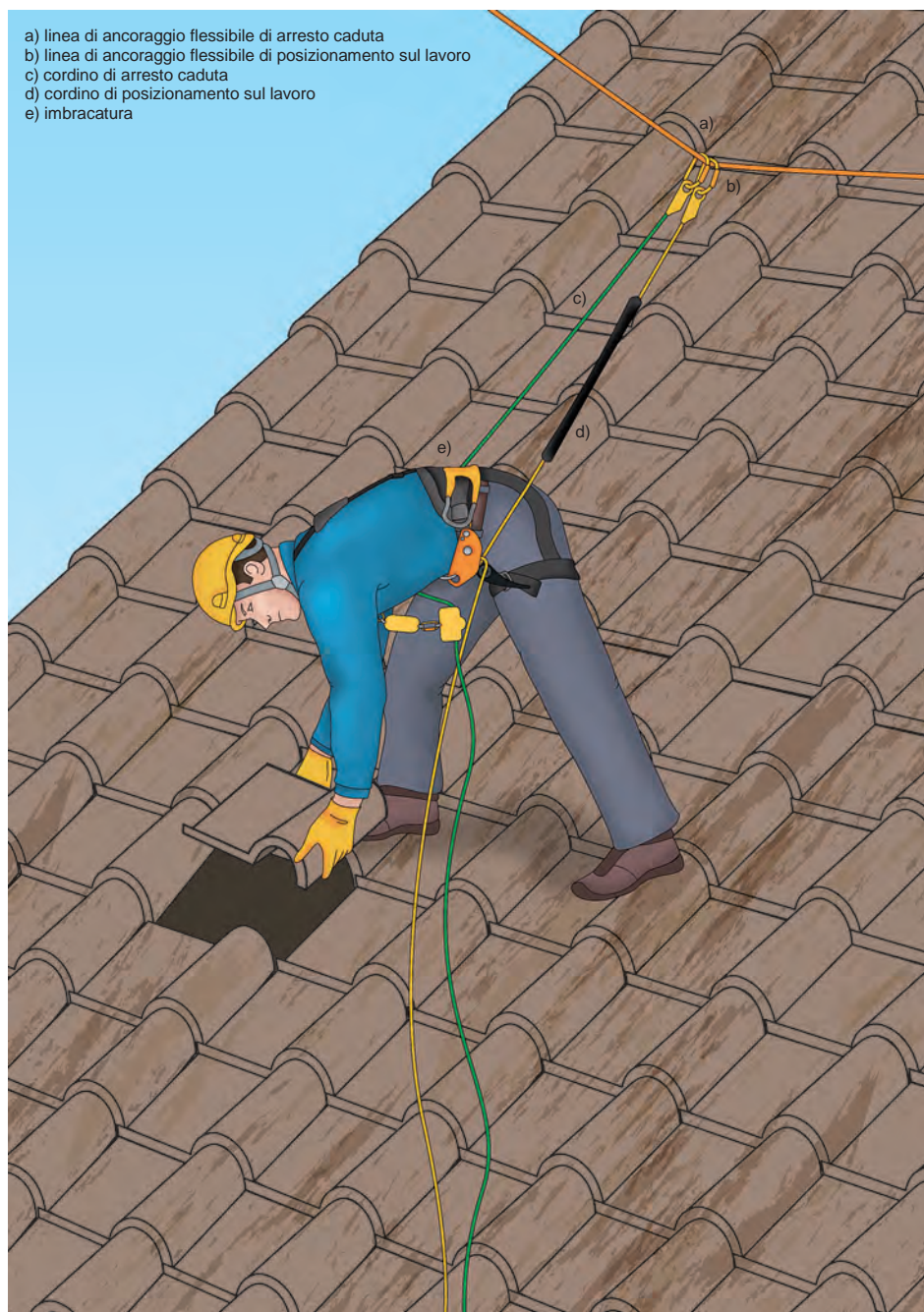
Figura 3 - Esempio di un sistema di posizionamento sul lavoro che include un sistema di arresto caduta