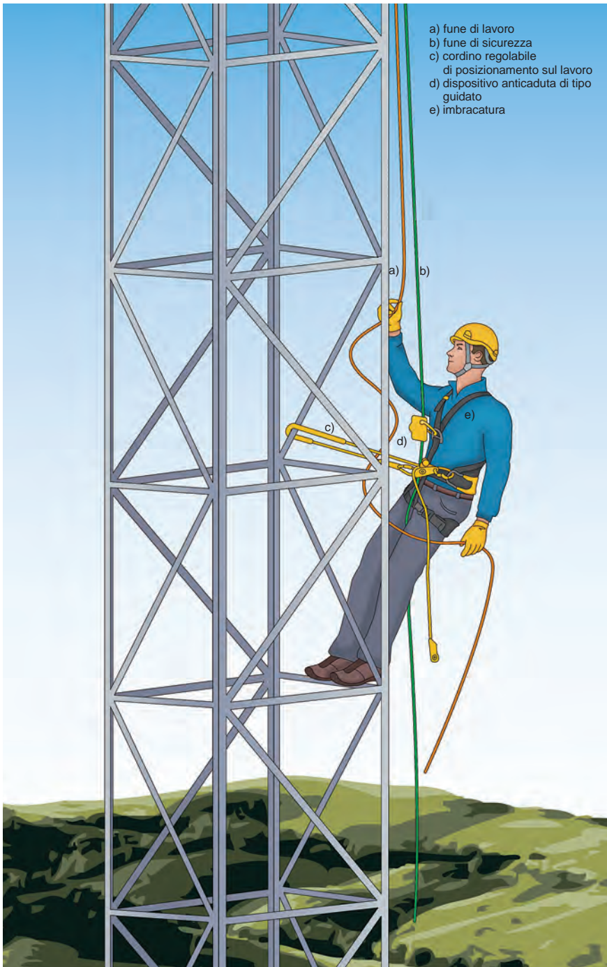
Figura 2 - Esempio di un sistema di posizionamento sul lavoro