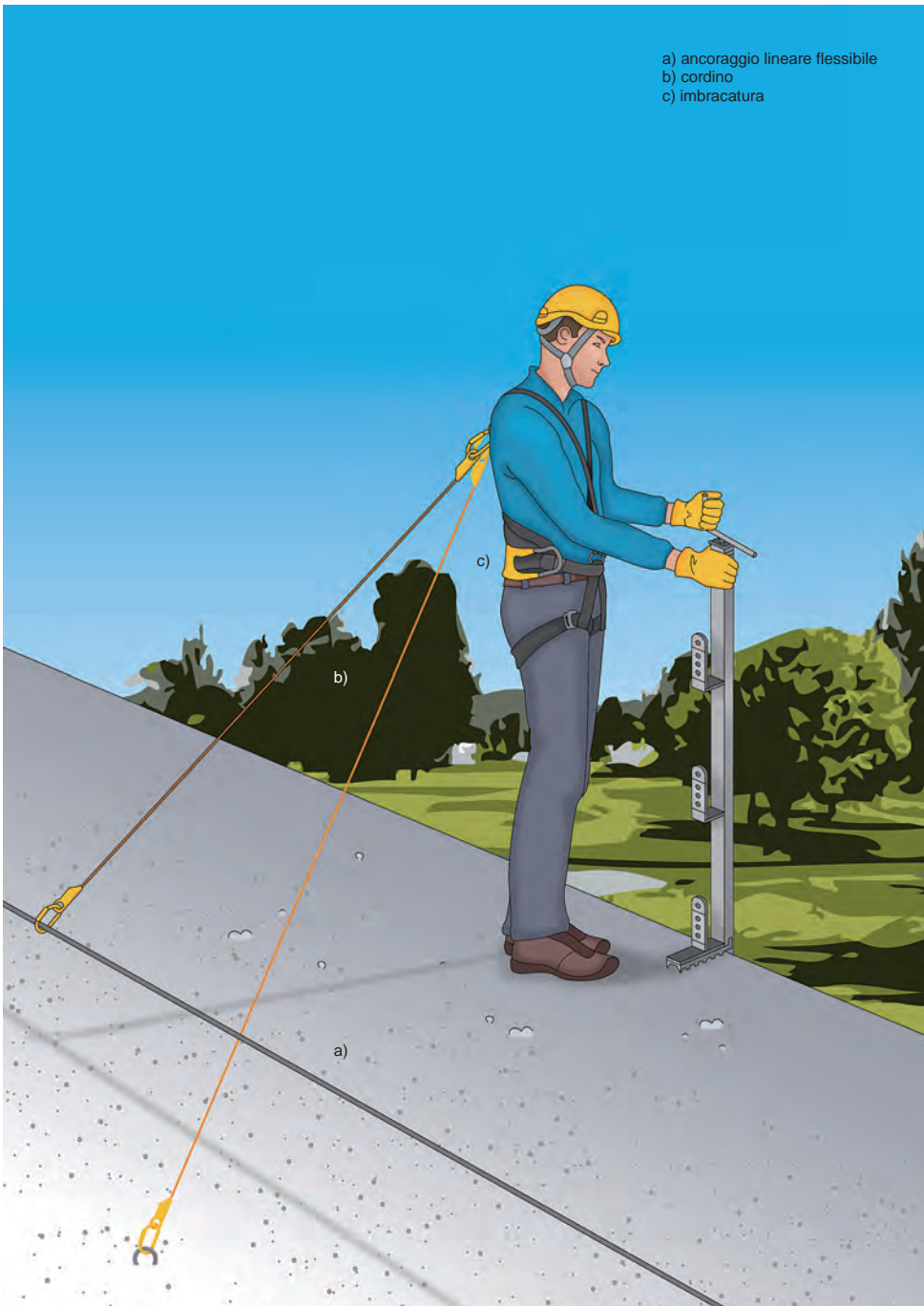
Figura 1 - Esempio di un sistema di trattenuta