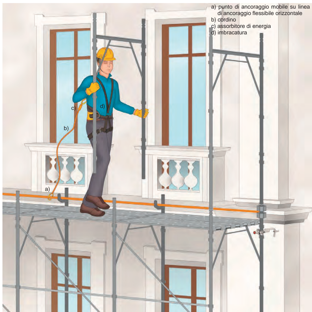
Figura 5 - Esempio di un sistema di arresto caduta su linea di ancoraggio flessibile orizzontale che include un cordino e un assorbitore di energia