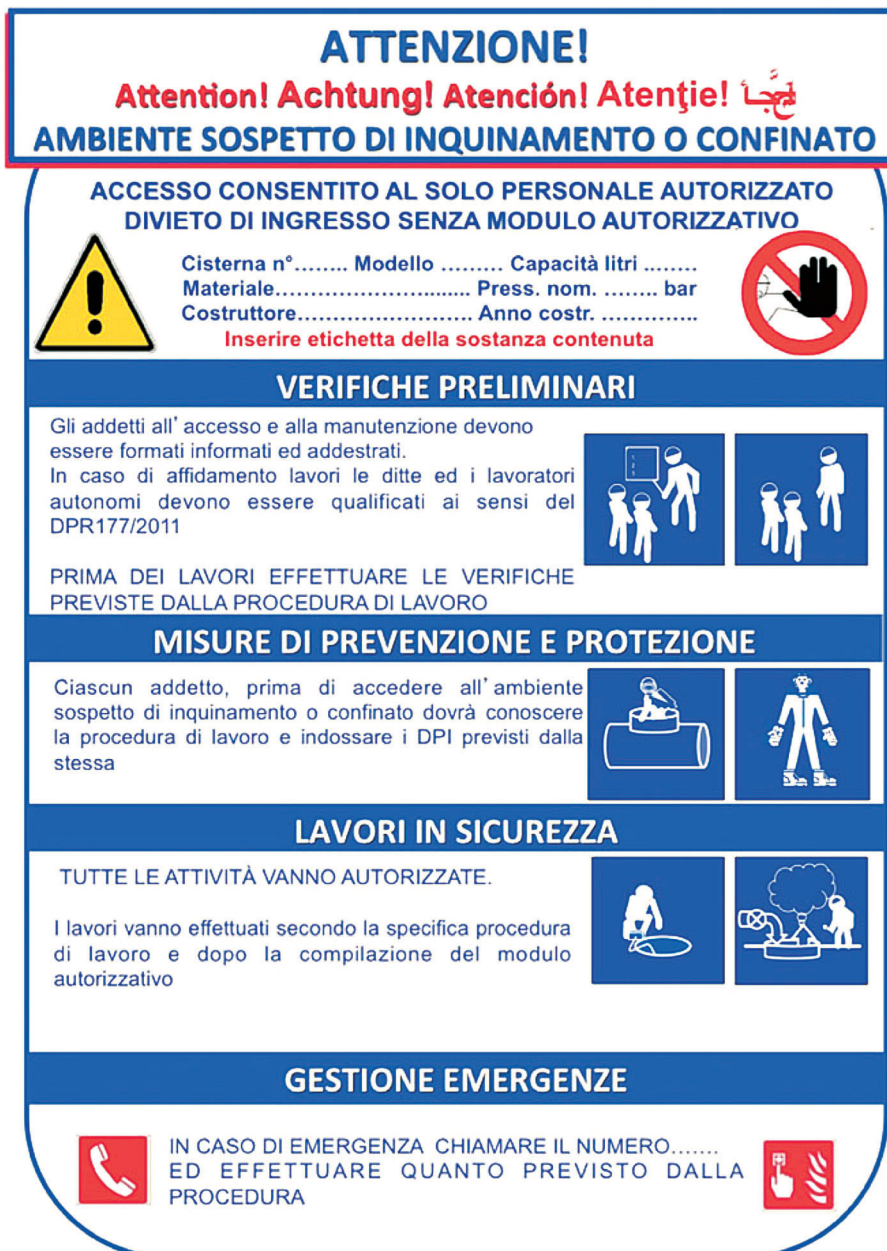
Figura 3: cartellonistica da apporre in ambienti confinati o sospetti di inquinamento : "Manuale illustrato Inail per lavori in ambienti sospetti di inquinamento o confinati ai sensi dell'art. 3, comma 3, del DPR 177/2011")