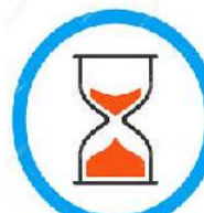
tempi di sosta ridotti