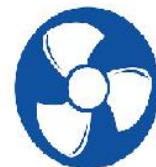
Ventilazione dei locali