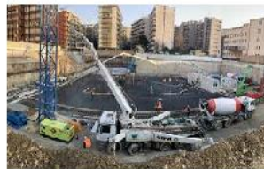
aree di cantiere comuni

L'accesso agli spazi comuni , comprese le mense e gli spogliatoi è contingentato, con la previsione di una ventilazione continua dei locali, di un tempo ridotto di sosta all'interno di tali spazi e con il mantenimento della distanza di sicurezza di 1 metro tra le persone che li occupano.