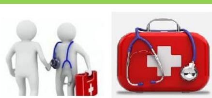
Servizio medico e apposito pronto intervento

Per cantieri di grandi dimensioni per numero di occupati (superiore a 250 unità)